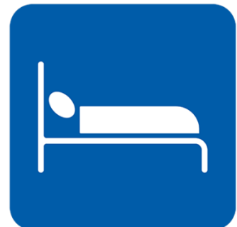
ከተቻለ ለብቻዎ ይተኙ