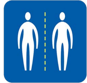
ከሰዎች ጋር ቅርብ ንክኪን ያስወግዱ።